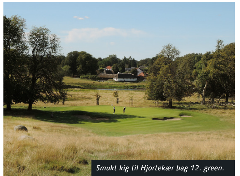
Smukt kig til Hjortekær bag 12. green.

"Vi er i den unikke situation, at vi stadig har en venteliste, og et fuldkommen stabilt medlemstal på 1.175 medlemmer, så vi har ikke noget egentligt behov for at markedsføre os som klub. Det er dog vores ønske, at rigtigt mange gæster udefra kommer og oplever vo-