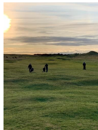
Gullane Nov. 2019

Klubbens forsøgsordning med DGU's gensidige gratis greenfee aftale for juniorer vil fortsætte i 2021, hvor der minimum skal være én betalende voksen op til max. tre gratis juniorer. Ordningen gælder kun gensidigt overfor de klubber der er tilmeldt ordningen i DGU.