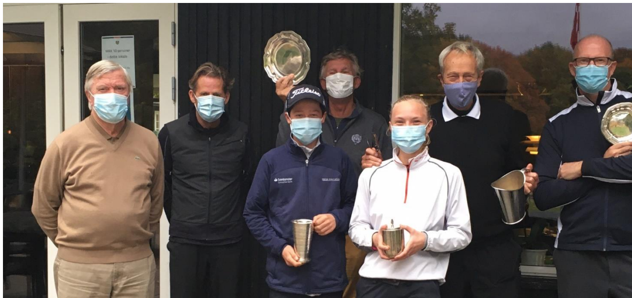
Klubmestre og Runner-ups 2020

Ud over de nævnte førstehold har vi yderligere to herrehold, et seniorhold samt et hold i den nye ungdomsrække. KGK er dermed sportsligt godt repræsenteret i Danmarksturneringen.