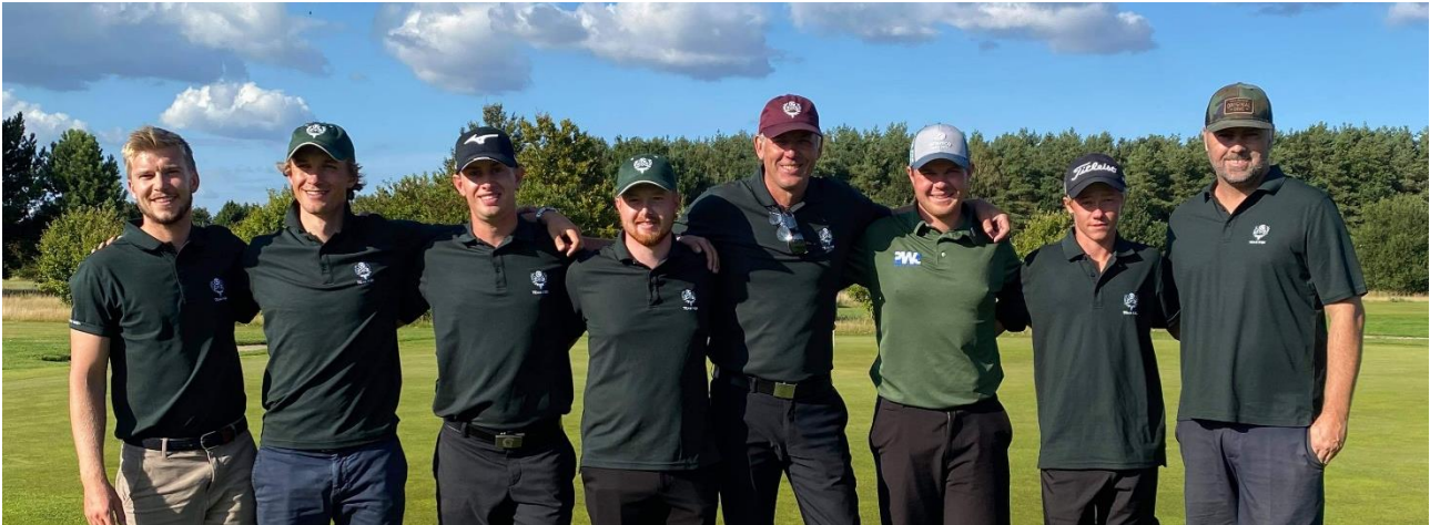
1. Hold Herrer 2021

Vi håber og glæder os til en god sportslig sæson i 2022, med store, gode og spændende golfoplevelser både individuelt og på alle KGK's klubhold.